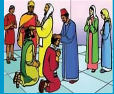
“EVANGELIZING BY PAUL AND BARNABAS”