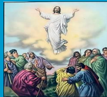
"JESUS ASCENDS INTO HEAVEN"