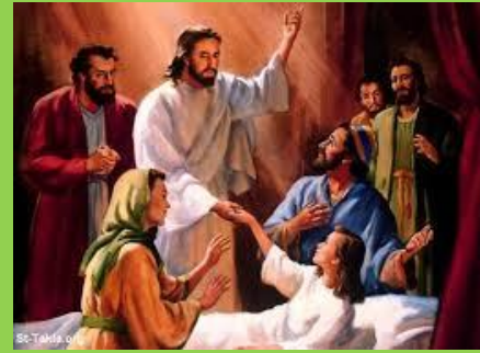
JESUS RAISES JAIRUS' DAUGHTER TO LIFE