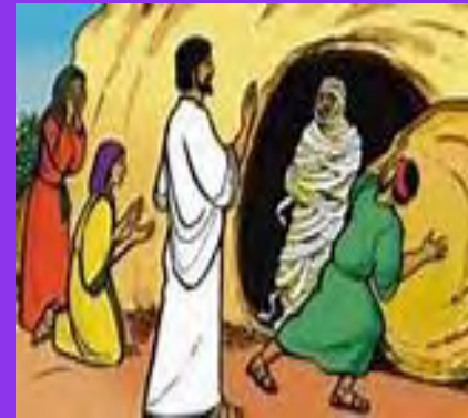
"JESUS RAISES LAZARUS "