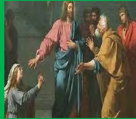
JESUS AND THE CANANITE WOMAN.