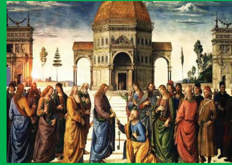
PETER: LORD, YOU ARE THE SON OF GOD.