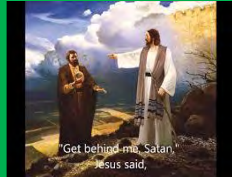
JESUS TO PETER: GET BEHIND ME SATAN.