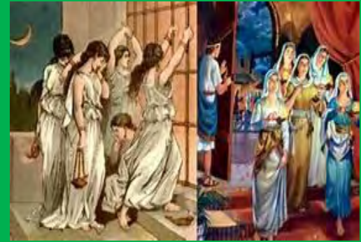
THE FOOLISH AND THE WISE VIRGINS.