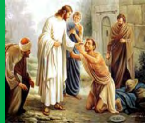
JESUS HEALS A LEPER