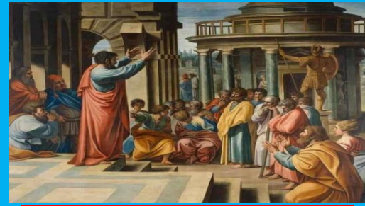
PETER PREACHES TO THE JEWS