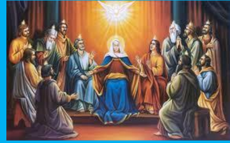
MARY AND THE APOSTLES RECEIVE THE HOLY SPIRIT