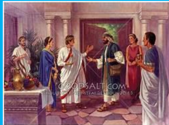
PETER BAPTIZES CORNELIUS' HOUSEHOLD