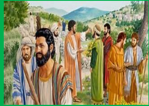
APOSTLES SENT TO PREACH