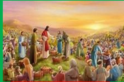
JESUS FEEDS 5000 MEN