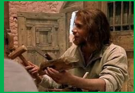
JESUS THE CARPENTER