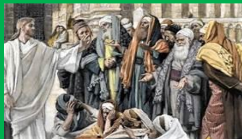
EATING WITH UNCLEAN HANDS