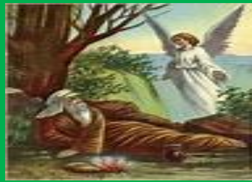
ELIJAH FED BY THE ANGEL