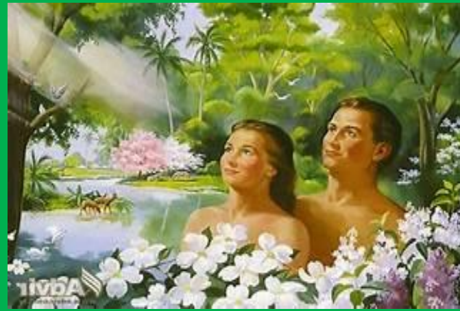
“SACREDNESS OF MARRIAGE”