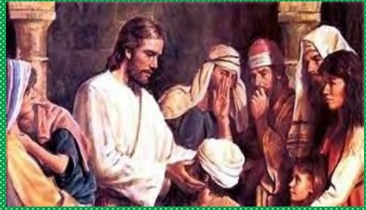
“EPIPHATA: BE OPENED”