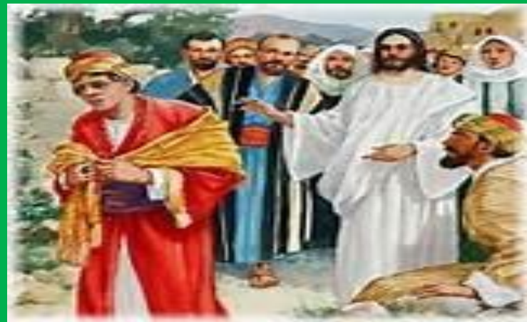
"THE RICH YOUNG MAN GOES AWAY SAD"