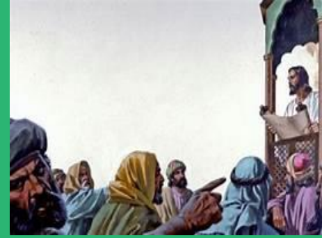
"JESUS IN THE SYNAGOGUE"