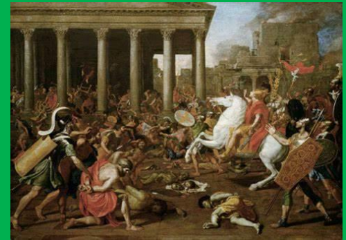
DESTRUCTION OF TEMPLE