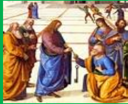
“WHO DO YOU SAY I AM?”